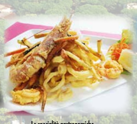
Le specialità gastronomiche Gastronomical traditions