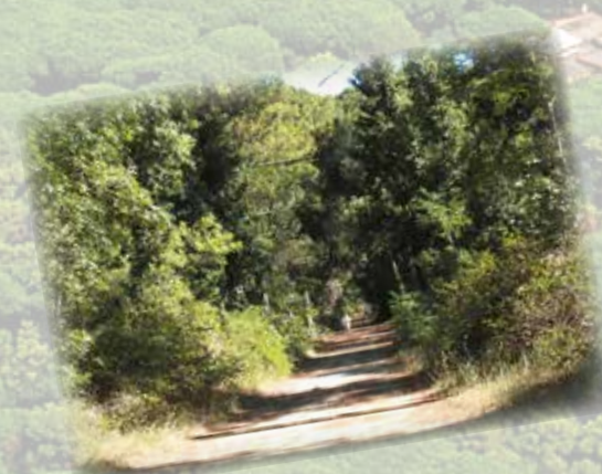
La pineta, ideale per mantenersi in forma (0,00 km) The pinewood, ideal for jogging