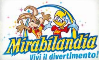
A soli 15 minuti da Mirabilandia, uno dei parchi divertimento più belli e divertenti d'Europa Just 15 min. far from Mirabilandia, one of the best and most amusing fun parks all over Europe