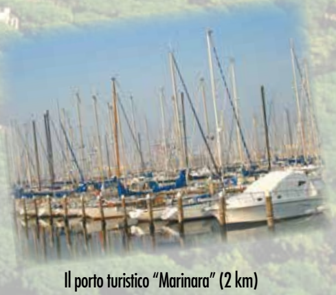
Il porto turistico "Marinara" (2 km) The port for tourists "Marinara"