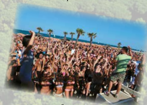
Feste sulla spiaggia Parties on the beach