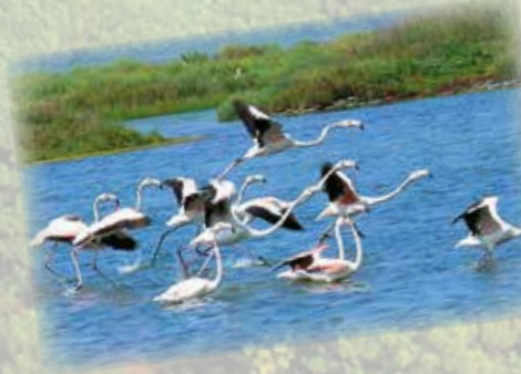
Birdwatching nel parco del Delta del Po Birdwatching in the Po Delta Park