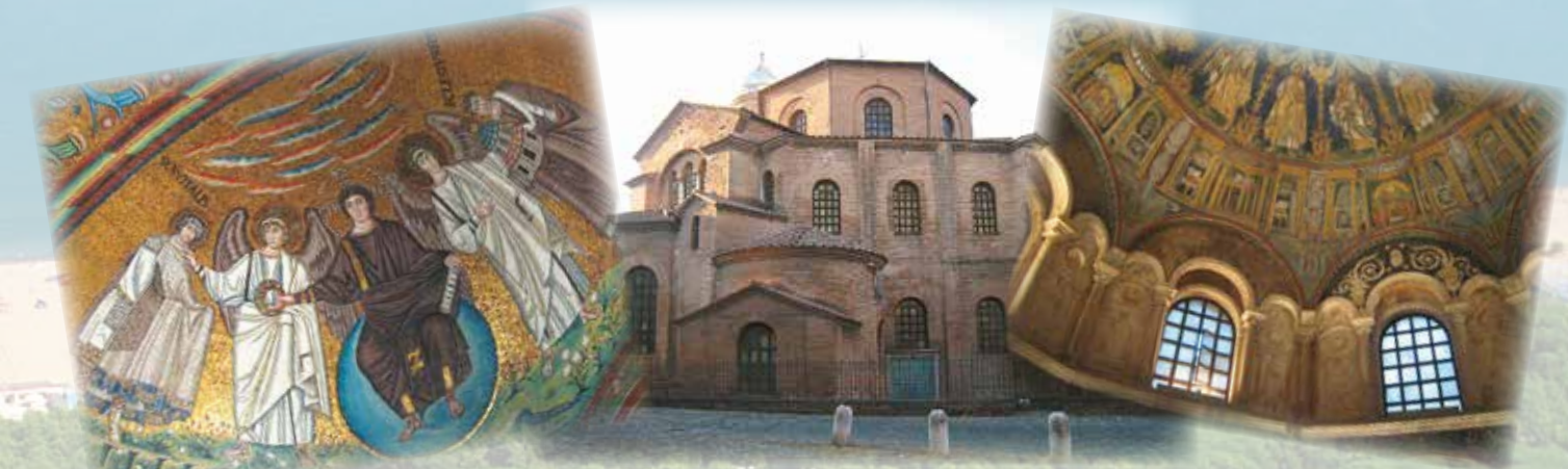
Ravenna, città d'arte e cultura bizantina, dichiarata dall'Unesco Patrimonio dell'Umanità (8 km) Ravenna, famous for its byzantine treasures, a Unesco World heritage site